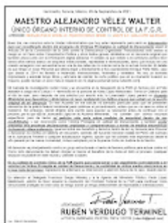
JPG Oficio FIRMADO Contralor FGR (29Sept2021).jpg 1339K